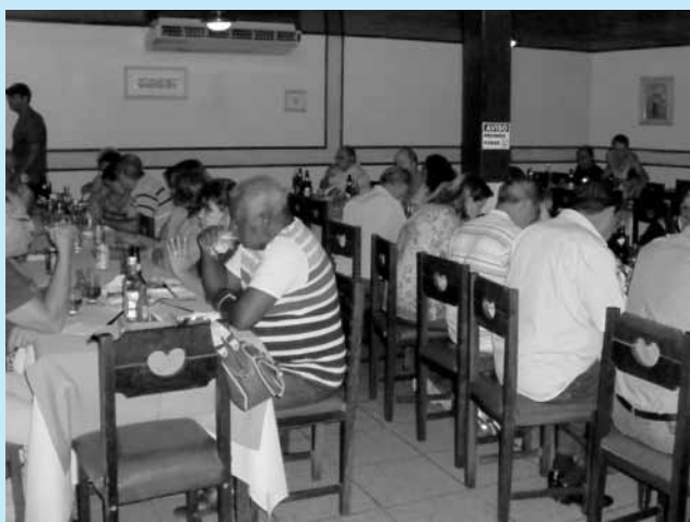
Itumbiara / GO

Como sempre acontece nesta época do ano, as celebrações foram muitas... E graças a colaboração e o empenho dos representantes regionais, a APÓS-FURNAS pôde promover confraternizações em várias cidades do Brasil. Espalhando assim, seus mais sinceros votos de um Novo Ano próspero e digno à todos os seus associados, amigos e parceiros.