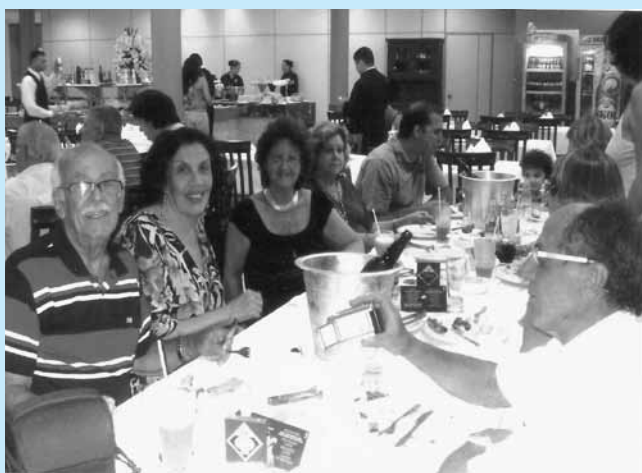
Ribeirão Preto / SP

É com imenso prazer que publicamos essas imagens de amizade, carinho e companheirismo. Contamos com todos para o ano que se inicia.