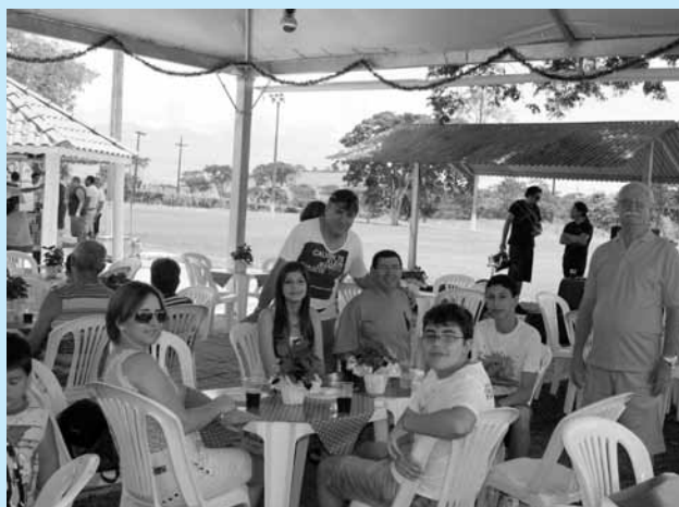
Cachoeira Paulista / SP