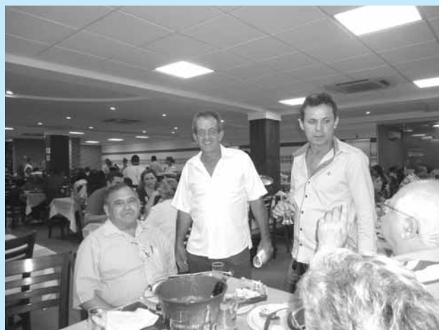
Goiânia / GO

No Rio de Janeiro, a confraternização aconteceu com direito a um jantar dançante, no Clube Hebraica, em Laranjeiras. No local, 600 convidados - entre associados e seus familiares - se reuniram para comemorar a chegada de 2013, na companhia de amigos e ex-colegas de trabalho.