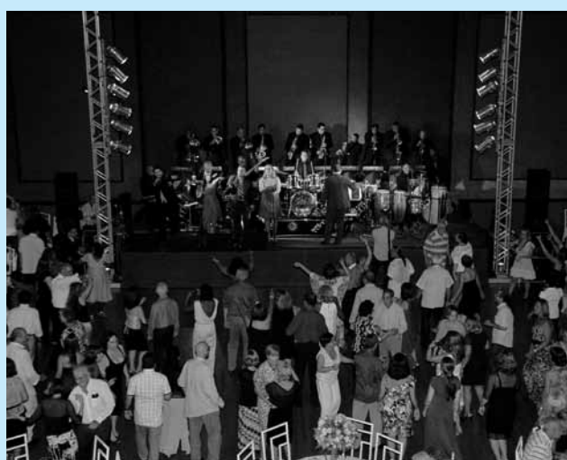
Rio de Janeiro / RJ