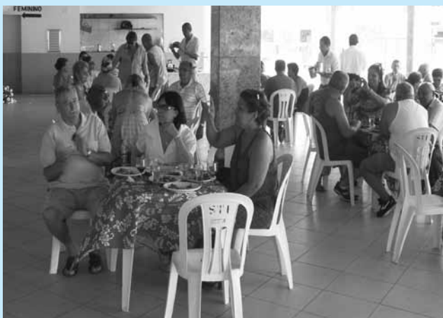
Campos / RJ