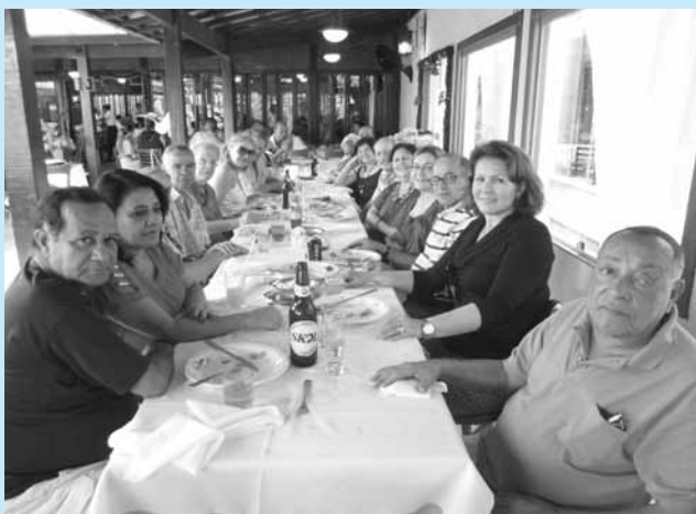
Belo Horizonte / BH

No Rio de Janeiro, a confraternização aconteceu com direito a um jantar dançante, no Clube Hebraica, em Laranjeiras. No local, 600 convidados - entre associados e seus familiares - se reuniram para comemorar a chegada de 2013, na companhia de amigos e ex-colegas de trabalho.