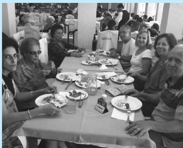
Franca / SP

A frente do som, a Orquestra Tupy animou os presentes durante toda a noite, cantando e tocando sucessos musicais dos anos 70 e 80. Ninguém ficou parado e a confraternização entrou madrugada à dentro. Parabéns a todos os organizadores deste belo evento!